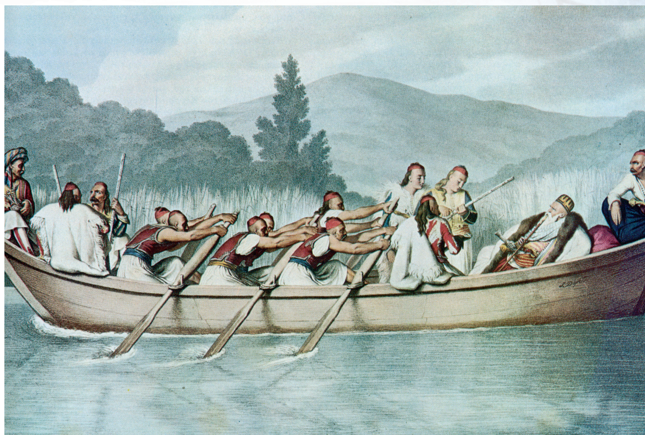
Ο Αλή Πασάς στη λίμνη του Βουθρωτού. Δεν κατάφερε να επεκτείνει την κυριαρχία του στη Λευκάδα εξαιτίας της επέμβασης του ρωσικού στόλου.

Ο ΑΛΗ ΠΑΣΑΣ ΚΑΙ Η ΠΟΛΙΟΡΚΙΑ ΤΗΣ ΛΕΥΚΑΔΑΣ