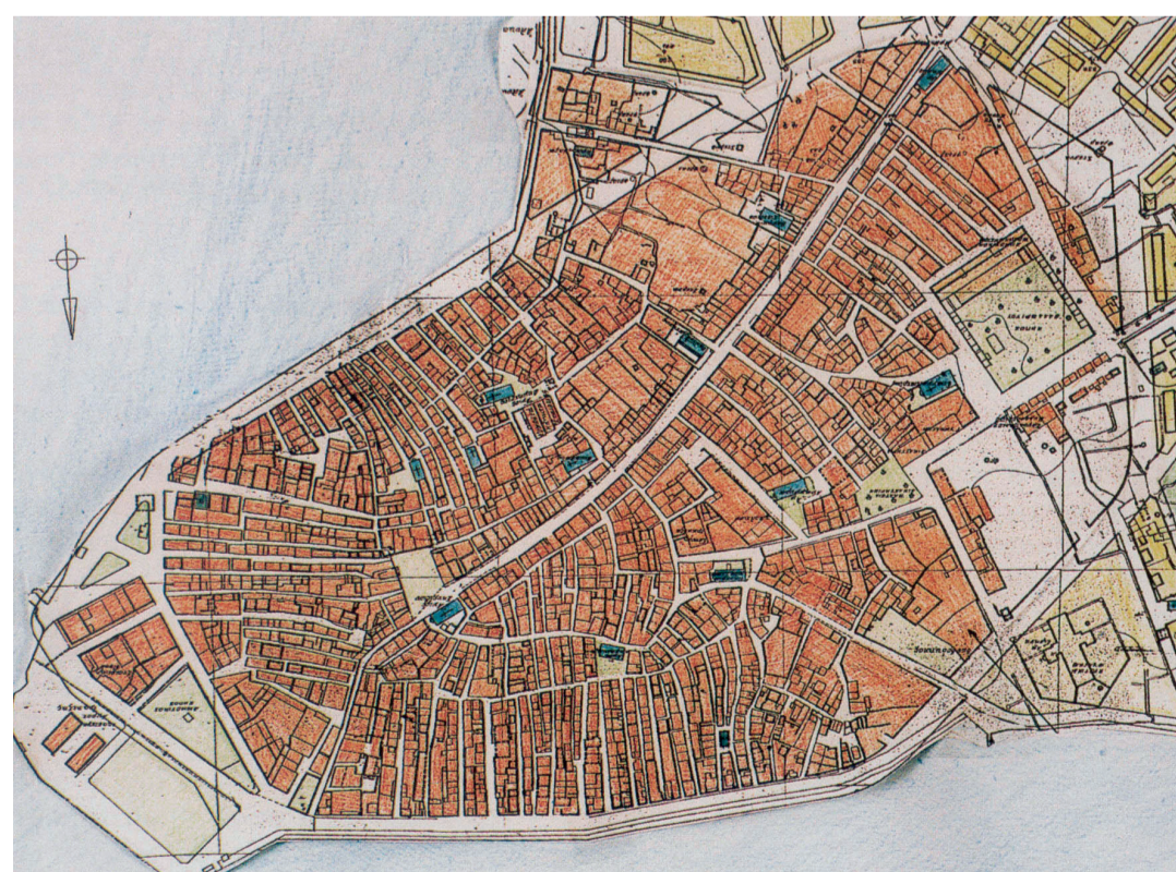
Πολεοδομικό και τοπογραφικό σχέδιο της πόλης της Λευκάδας (1726).

«1820, Μάρτιος 17. Πολύ ισχυρός σεισμός εις την Λευκάδα κατέστρεψε ένα μεγάλο μέρος της πρωτεύουσας. Οι εκκλησίες και όλα σχεδόν τα λιθόκτιστα σπίτια, επίσης ένα μέρος του Φρουρίου εις το LIDO κατέρρευσαν. Ευτυχώς δεν εσημειώθησαν θύματα, διότι οι κάτοικοι προειδοποιηθέντες από ένα υπόκωφο και συνεχή κρότο εκ δυσμών και από ανύψωσιν της θαλάσσης καταφοβηθέντες επίσης από μια ανεμοθύελλα, κατέφυγαν στην ύπαιθρο... » Νικόλαος Ζαμπέλης γράφω, Κατάστιχον Αγίου Νικολάου εις την Αγίαν Μαύραν εις την Αμαξικήν.