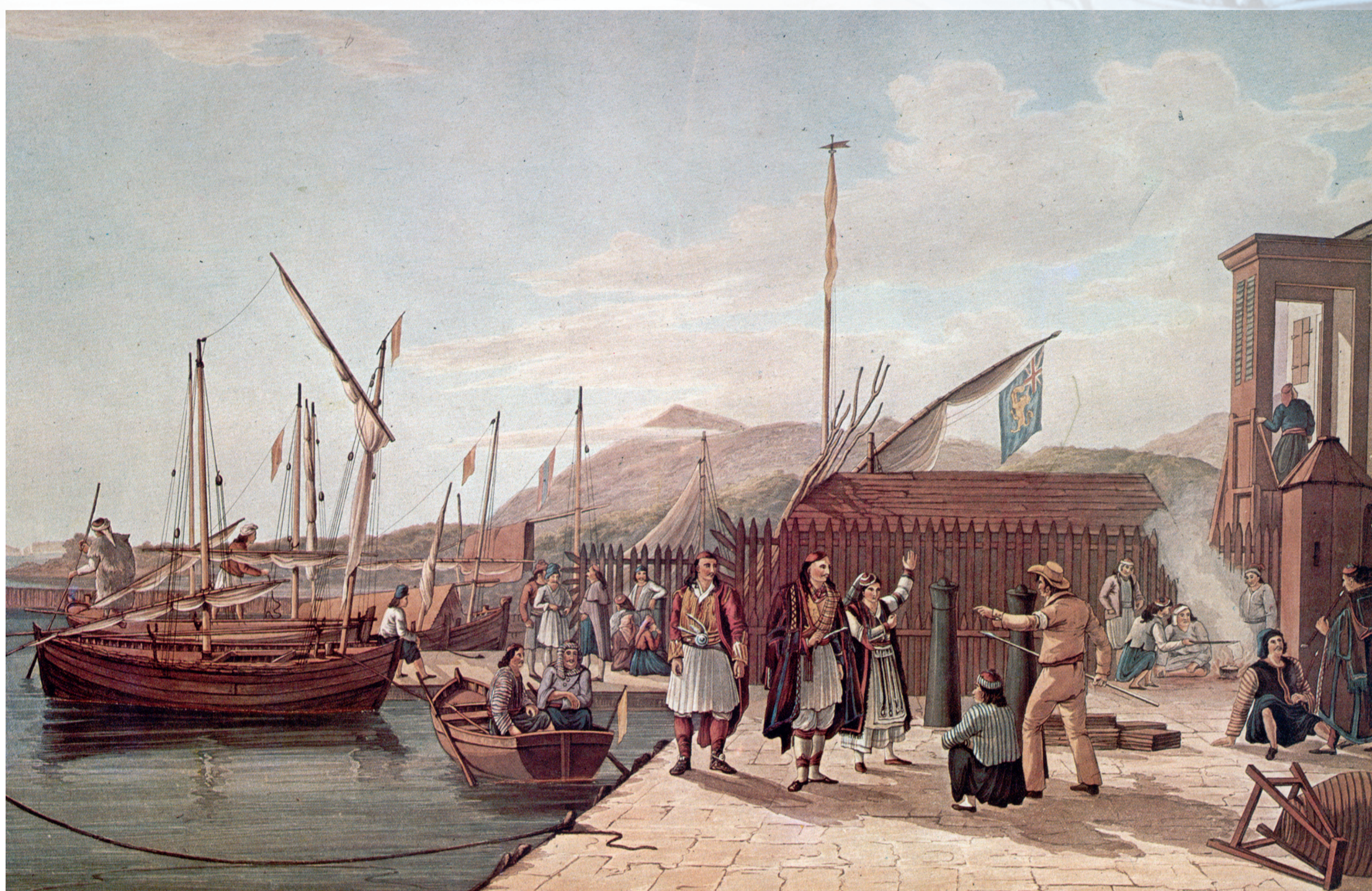
Το λοιμοκαθατήριο της Λευκάδας, έργο του J. Cartwright. Δημοσιεύτηκε το 1821 μαζί με άλλες 11 ακουατίντες με τίτλο Views of the Ionian Islands που ο καλλιτέχνης αφιέρωσε στον πρώτο Βρετανό Υπάτο Αρμοστή των Ιονίων Νήσων, Sir Thomas Maitland.

Η Λευκάδα περιήλθε στους Βενετούς το 1683. Από τα πρώτα μέτρα που πήραν ήταν η μεταφορά της πρωτεύουσας του νησιού κοντά στο Φρούριο της Αγίας Μαύρας, στη θέση Αμαξική, έτσι ώστε να διευκολύνεται η άμυνα της πόλης. Το πρώτο πολεοδομικό σχέδιο της Χώρας χρονολογείται από το 1726.