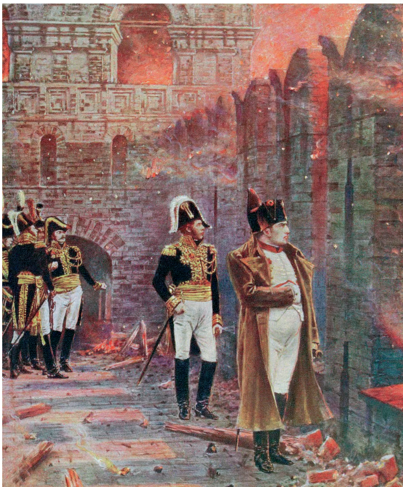
Ο κόμης Φιοντόρ Βασιλίβιτς Ροστοπτσίν, διοικητής της Μόσχας, συντόνισε την άμυνα και την τόνωση του ηθικού των κατοίκων και διέταξε την πυρπόλησή της λίγο πριν εγκαταλειφθεί η πόλη στα στρατεύματα του Ναπολέοντα.