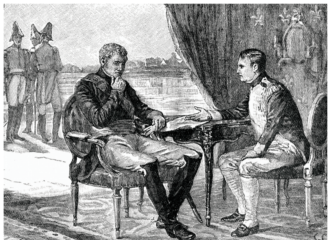
Ο πόλεμος γέμισε τον Τσάρο Αλέξανδρο με αποφασιστικότητα. Λέγεται πως είπε: «Η ο Ναπολέον ή εγώ. Από εδώ και πέρα δεν μπορούμε να βασιλεύουμε και οι δύο!».

Τον Ιούνιο του 1812 ο Ναπολέοντας ξεκίνησε επικεφαλής του μεγαλύτερου στρατού που είχε δει ποτέ η Ευρώπη. Στόχος του ήταν να αναγκάσει τον Τσάρο Αλέξανδρο να συμμορφωθεί με τους όρους της συνθήκης που του είχε επιβάλει τέσσερα χρόνια πριν. Χιλιάδες Γάλλοι, αλλά και πεζικάριοι από τις χώρες που είχε στο μεταξύ υποτάξει ο Ναπολέοντας, άρχισαν να διασχίζουν την ήπειρο με τα πόδια. Στους Ρώσους στρατηγούς του Αλέξανδρου ήταν ξεκάθαρο πως δεν θα μπορούσαν ποτέ να αντιμετωπίσουν κατά μέτωπο μια τέτοια στρατιά. Δεν τους έμενε παρά να υποχωρούν στις αχανείς ρώσικες πεδιάδες, αφήνοντας πίσω τους καμένη γη.