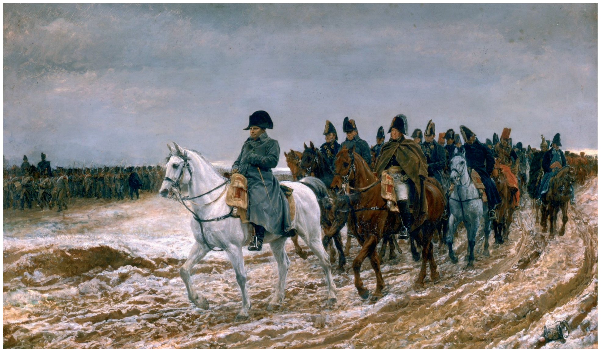
Στις 5 Δεκεμβρίου ο Ναπολέοντας εγκατέλειψε τον αποδεκατισμένο στρατό του και έφυγε βιαστικά με έλικθρο για να γυρίσει στο Παρίσι, όπου ετοιμαζόταν επανάσταση.

Καθώς ο Ναπολέοντας πλησίαζε τη Μόσχα, ο Τσάρος έδωσε διαταγή να εκκενωθεί. Οι λίγες δυνάμεις του Ναπολέοντα που έζησαν την είσοδό τους στην πόλη, τη βρήκαν έρημη από κατοίκους και άδεια από προμήθειες. Ο Τσάρος αρνήθηκε να διαπραγματευτεί με το Ναπολέοντα και αποσύρθηκε στην Αγία Πετρούπολη. Κι αυτός, ηττημένος και εγκλωβισμένος, δεν είχε άλλη διέξοδο από το πάρει το δρόμο της επιστροφής, στη διάρκεια ενός ιδιαίτερα σφοδρού χειμώνα. Κι έτσι, ενώ τα εσωτερικά προβλήματα της Ρωσίας πλήθαιναν, ο Τσάρος Αλέξανδρος έμεινε γνωστός κυρίως ως ο ηγέμονας που αναχαίτισε τις στρατιές του Ναπολέοντα και έβαλε τέλος στην κυριαρχία της Γαλλίας.